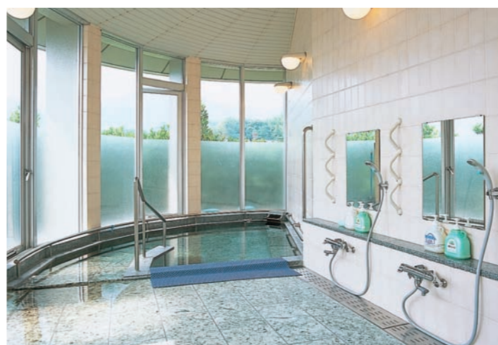
デイサービス浴室