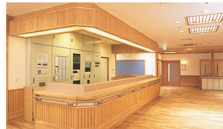
ケアワーカーサブステーション